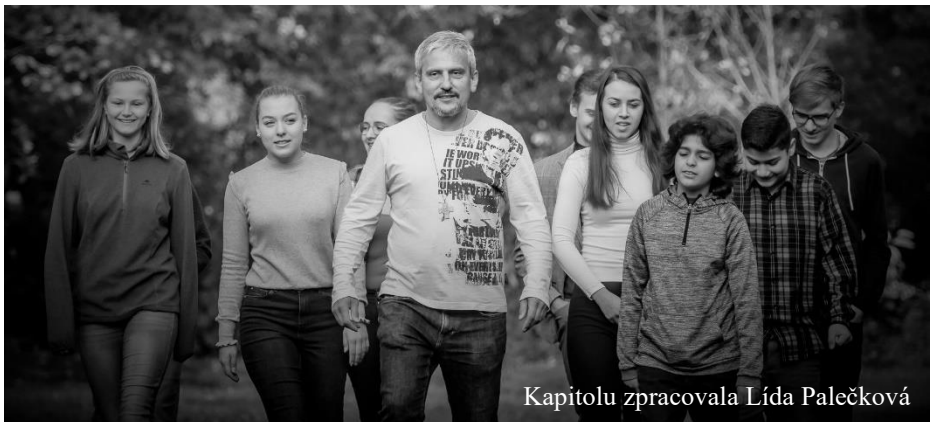
Kapitolu zpracovala Lída Palečková

Dobrý Bože, my lidé jsme pustili do světa zlo, od kterého nejsme schopni se sami osvobodit. Děkujeme, že jsi přišel, vykoupil jsi nás a zůstáváš s námi. Pomáhej nám přemáhat zlo ve svém srdci, otevírat se Tobě – Lásce a být kvasem v našem propojeném světě. Ať jsme schopni opouštět svoje předsudky k lidem, kteří jsou nějak jiní než my. Ať rozšiřujeme svoje srdce velkorysostí a učíme se otevřenému dialogu se všemi. Prosíme také za naše politiky a státníky, aby se nechali inspirovat Tvým Duchem, aby mohl být budován spravedlivý mír a smír na státní a mezinárodní úrovni. Neboť bez Tebe, Pane, nemůžeme nic, ale vše můžeme v Tobě. Amen.