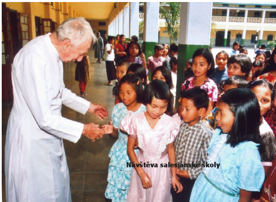
Návštěva salesiánské školy